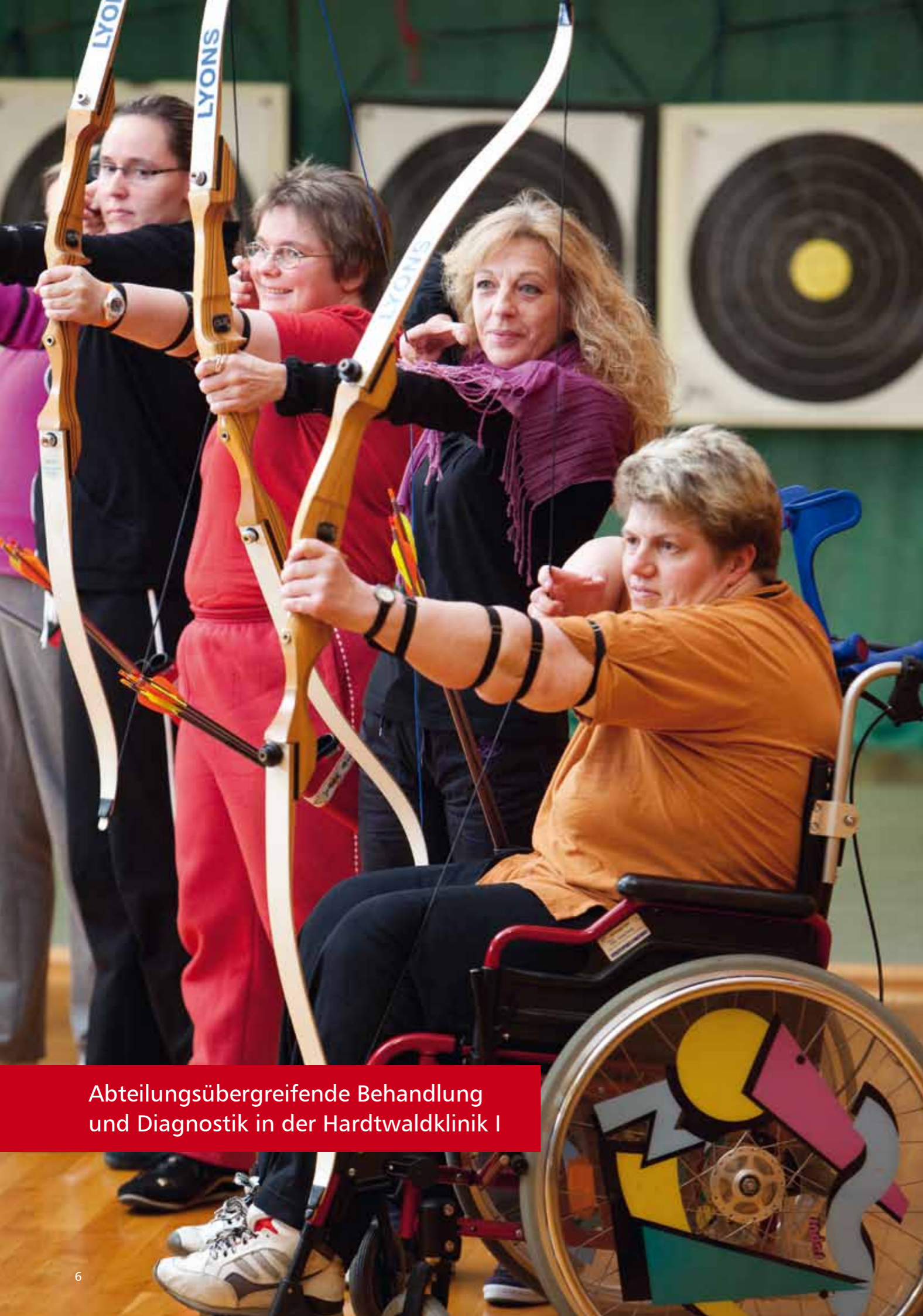
Abteilungsübergreifende Behandlung und Diagnostik in der Hardtwaldklinik I